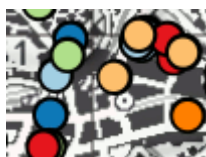
Bâtiments des institutions importantes et centres culturels subventionnés