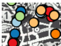
Gebäude wichtiger Standorte und subventionierte Kulturbetriebe